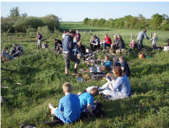
Picnic ved stenbunken på første arbejdsdag og nattergaletur den 25. maj.

Mange medlemmer er mødt op til vores arbejdsdage for at give en hånd med. Der er blevet slået med le og krattrydder, klippet fårehegn af så man bedre kan komme til at slå under hegnet, gravet kæmpe-bjørneklo op og lagt sten ud på det mudrede stykke, så man kan komme nogenlunde tørskoet rundt i folden.