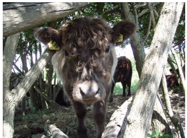
Einstein har søgt tilflugt for solen i skyggen under hylde træerne.

Bagefter vil vi gerne lave et hyggeligt arrangement med grill og socialt samvær. Arrangementet er selvfølgelig afhængigt af rimeligt vejr. Mere info senere.