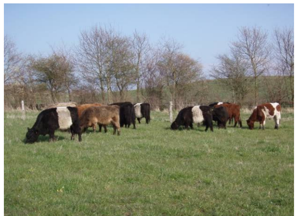
Sådan ser den brogede flok ud i år.

Der er mulighed for at dele mose i tre folde. Det benyttede vi os af i starten af sæsonen. April har været ret våd, og da tretten stude vejer en del, blev de to første folde hurtig mudret. Derfor blev dyrene lukket ind i den fjerneste fold i en kort periode for at tillade vegetation at få fat. Nu råder de over hele arealet igen, men vi tager bestik af situationen og vil evt. lukke dem ind i fold 3 hvis det igen bliver meget vådt.