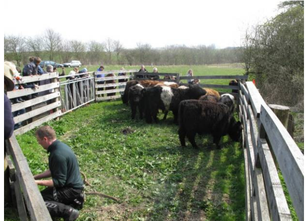
Efter mindre end ti minutter er der næsten ingen mad tilbage i fangfolden.

Efter en lille time blev de sluppet ud i den første del af folden. Dyrene synes at være en fin samlet flok, som vist er blevet gode venner under transporten.