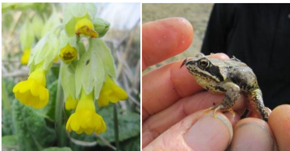
Kodriver med de første blomster og butsnudet frø

Så var der ikke andet at gøre end at tage en runde i mosen, hvor de første blomstrende hulkravet kodrivere var fremme sammen med de sidste anemoner.